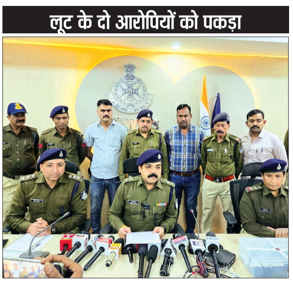
देवास। एसपी ने प्रेस कॉन्फ्रेंस में पत्रकारों से चर्चा कर दी जानकारी।