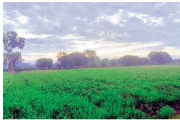
हरिभूमि न्यूज ॥ राजगढ़

इस हफ्ते की शुरुआत में जिले का न्यूनतम तापमान 5 डिग्री सेल्सियस के आसपास पहुंचते हुए देश में सबसे कम रिकॉर्ड हुआ था। लेकिन, धीरे-धीरे तापमान में हल्की उछाल आई है। गुरुवार को जिले का न्यूनतम तापमान 7.5 डिग्री दर्ज किया गया ऐसे में सर्दी से हलाकान लोगों ने कुछ हद तक राहत की सांस ली। हालांकि, सर्द हवाओं का दौर जिले में अभी भी जारी है और चैबीसी घंटे कोल्ड वेव के चलते दिन में भी अलाव जलते हुए देखे जा रहे हैं। मौसम के जानकारों का कहना है कि अभी कुछ दिन और ऐसे ही शीतलहर चलती रहेगी लेकिन उसके बाद तापमान में ज्यादा गिरावट देखने मिल सकती है।