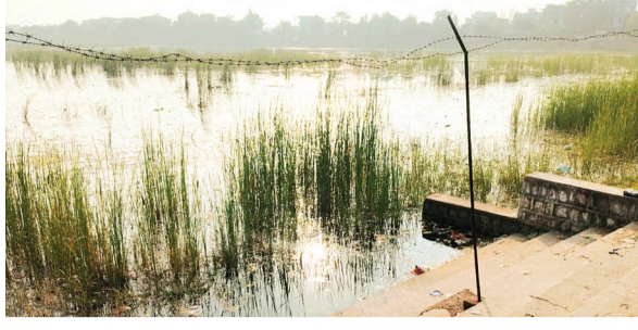
हरिभूमि न्यूज ललितपुर