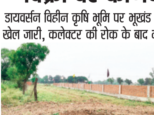
हरिभूमि न्यूज ॥ सारंगपुर

नगरीय सीमा में रेलवे स्टेशन के सामने स्थित कन्या लक्ष्मीबाई छात्रावास के समीप पिछले लगभग तीन दशकों से अवैध कॉलोनी का निर्माण और रजिस्ट्री धड़ल्ले से जारी है मामला एक बार फिर सुर्खियों में। स्थानीय सूत्रों के अनुसार शासकीय प्रतिबंधों के बावजूद जमीन की रजिस्ट्री नामांतरण हो रहा है। हालात यह हैं की कलेक्टर द्वारा रोक लगाए जाने के बाद भी नामांतरण की प्रक्रिया बंदनरूप से जारी रहने की चर्चाएं सामने आ रही हैं। नागरिकों का कहना है की कलेक्टर के निर्देश के बावजूद स्थानीय प्रशासन ने पुराने मामलों में खबर लिखे जाने तक वास्तविक जांच नहीं की और न ही नया अवैध खरीदी बिक्री सहित नामांतरण को रोक़ा गया। परिणामस्वरूप यह पूरी कॉलोनी अब विवादित भूमि बसाई जा रही है। नगर में कई चिन्हित अवैध कालोनी है और कुछ अवैध कालोनी है जिसकी जानकारी राजस्व अधिकारी को अभी तक नहीं है उनमें भी खरीदी बिक्री का काम जारी है।